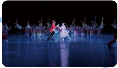
"La pequeña cerillera" de KASAI Dancing Company y Bohemia Ballet