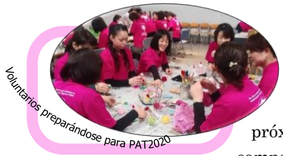
Voluntarios preparándose para PAT2020