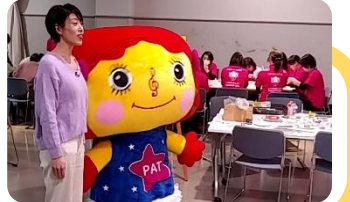
Pat-chan, la mascota del festival, promocionando el evento.

Con la esperanza de que la pandemia se disminuirá el próximo verano, nos estamos preparando con entusiasmo para compartir la alegría con los niños de todo el mundo, a través de las actuaciones de niños y adultos para los niños, y los intercambios culturales internacionales bajo el tema " Construimos el futuro ". Este Festival tiene como objetivo promover el intercambio cultural mutuo y la amistad entre los participantes a través de actuaciones artísticas de diversos géneros (teatro, danza, música, etc.) y diversas actividades de intercambio como talleres, una excursión en la Prefectura de Toyama, fiesta de intercambio, etc., para profundizar el entendimiento mutuo, la amistad y aprender sobre la cultura del otro. Creemos que los participantes pueden disfrutar plenamente de su estancia en Toyama.