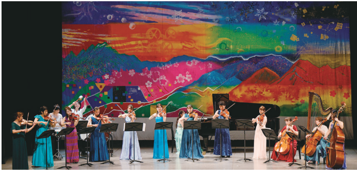
県美術連合会共同制作の舞台背景幕の前で演奏するOASISアンサンブル

学校書道部 による書道 パフォーマ ンスのコラ ボレーショ ンが幕開 けを飾り、 祝祭に相 応しく華や かで盛りだ くさんの公 演となりま した。