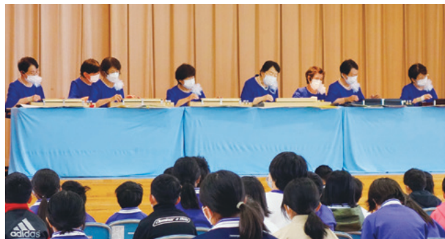
10月25日(火) 砺波市立鷹栖小学校