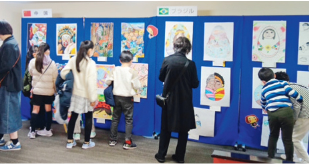
海外8カ国の子どもの絵を展示