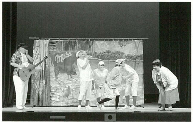
劇団プレイヤーズ・スタジオ・デプレツェン(ハンガリー)による 「みにくいあひる」日本語上演