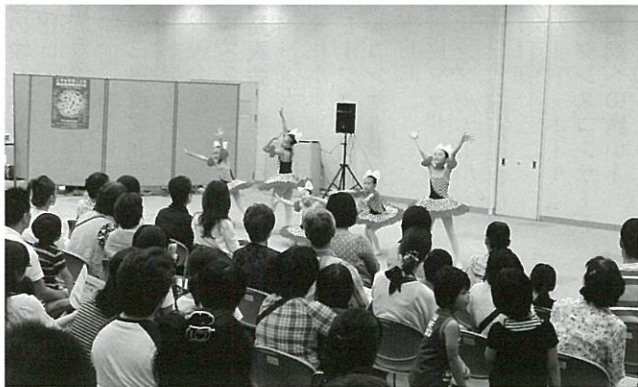
6月24日 イオンモール高岡でのPR公演 可西舞踊研究所