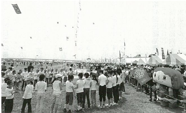
5月20日 越中大門凧まつりで連凧、「PATちゃん」大凧揚げ