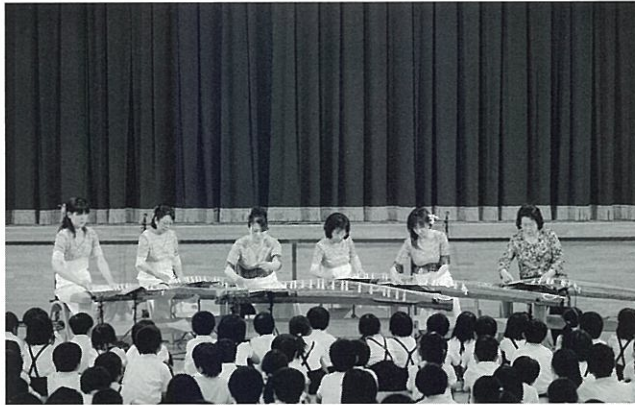
富士原文以千乃社中(華系の会)