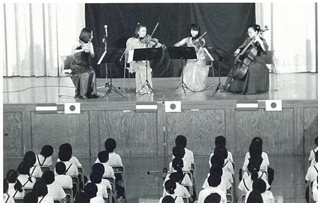
レディース・アンサンブルOASIS