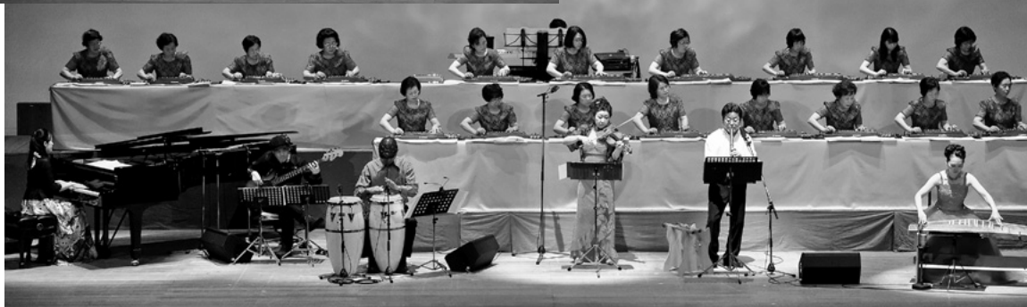
フィナーレ ビギン・ザ・ビギン