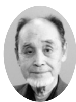
上田蟬丸さん (小説)