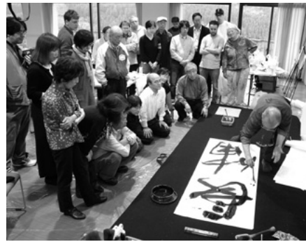
書道ワークショップ

ま国際アートキャンプ2015作品展」として、第64回富山県芸術祭美術連合展と併催して展示しました。