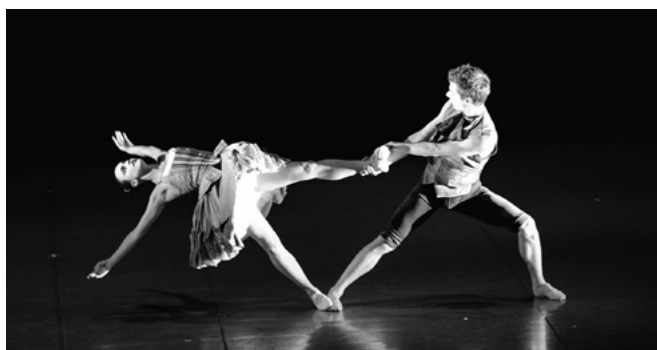
国際交流公演 (チェコ・プラハ芸術大学舞踊学科)