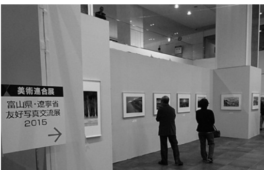
美術連合展 富山県・遼寧省 友好写真交流展 2015

また本友好写真交流展は第64回富山県芸術祭美術連合展と併催し、また新たな刺激を富山の美術界に与えました。