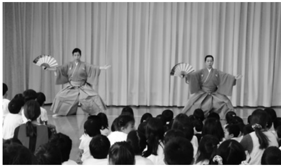
9月7日 認定こども園城南もなみ学園

10月17日(土)加積公民館(魚津市農村環境改善センター)では、大正琴と洋舞と洋楽の公演が開催されました。最初の大正琴公演は、アンサンブルミズキの息の合った迫力ある演奏に観客は引き込まれていました。次の大川都バレエ教室は、バレエレッスンを観客に分かりやすく紹介し、バレエの美しい身のこなしを披露しました。最後の「やまレディースオーケストラOASIS(オアシス)」は、「美しく青きドナウ」から「四季