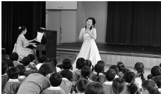
11月11日 社会福祉法人秀愛会大沢野ちゅうおうこども園

ように歌い演奏しました。次の洋舞公演は富山県洋舞協会の4団体合同公演で、クラシックバレエからモダンバレエまで様々な踊りを披露。表現豊かなバレエの動きを園児は真似をして、バレエの魅力を感じていました。