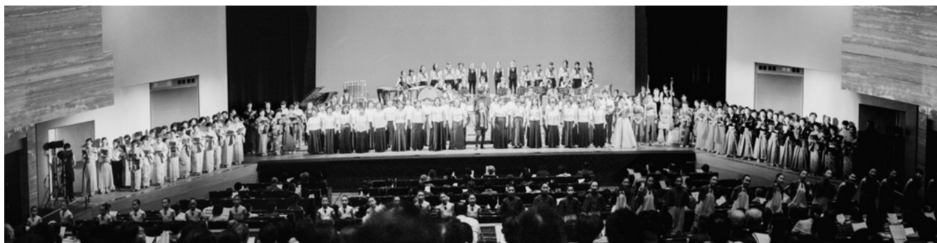
オープニングフェスティバル フィナーレ