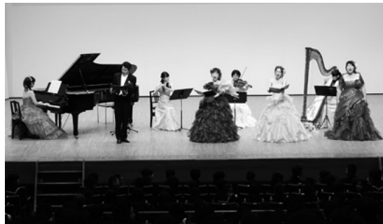
11月10日 砺波市文化会館

楽とピアノ、洋舞の公演を行いました。声楽とピアノ公演では、「サウンドオブミュージック」より「エーデルワイス私のお気に入り」など園児に優しく語りかける