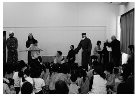
12月24日 社会福祉法人浦山学園福祉会小杉西部保育園

12月24日(休)には社会福祉法人浦 山学園福祉会小杉西部保育園で大 正琴とオペラの公演を行いました 。大正琴公演では、宗家岡田 流大正琴富希がお揃いの衣装 で「アンパンマン」のマーチなどを 演奏し、園児たちは体を動かして 楽しんでいました。オペラ公演で は、富山県オペラ協会が「アマ ールと夜の訪問者」を熱演。園児た ちは美しい歌声とピアノで織り成