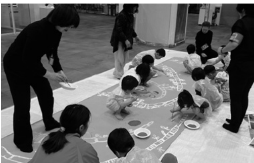
子どものための絵画ワークショップ

21日25日までの本展には1万1050人が来場しました。また会期終了後の巡回展では、県内3会場で主な入賞作品を展示しました。