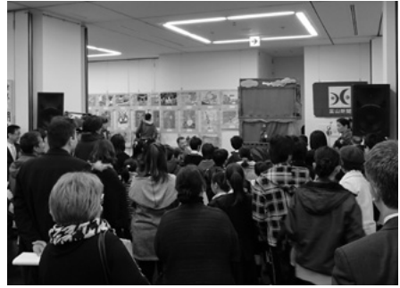
展示会場でも披露された人形劇公演

海外からの特別展示として、ハンガリーのハイドウゥビハール県・ハイドウナーナージュ、中国の遼寧省・上海、韓国の江原道、ロシアの沿海地方、バーレーン、アメリカのオレゴン州、ブラジル、リトアニアの子どものたちの児童画137点と、エクアドルやエジプトなど11か国から寄せられた児童画41点もあわせ、計18か国178点の児童画が展示されました。また、ハンガリーのハイドウゥビハール県・ハイドウナーナージュ、韓国、オーストラリア、ベルギー、アメリカの子どものたちからは創作童話15作品が特別に寄せられました。