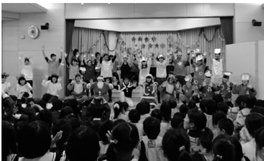
12月25日 社会福祉法人市野瀬福祉会市野瀬保育園

12月25日(金)の社会福祉法人市野 瀬福祉会市野瀬保育園では、富山 県立新湊高等学校吹奏楽部が吹奏 楽の演奏を披露。クリスマスにち なんだ曲やアニメの曲が演奏さ れ、楽しい雰囲気の中、会場はと ても盛り上がりました。