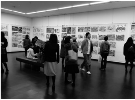
展示部門 海外からの特別展示

第38回富山県子どもフェスティバルの展示を、平成27年11月28日(土)30日(月)に富山県民会館にて開催しました。展示部門には、児童画393点、書653点、写真16点、童画14点の応募があり、来場者の目を惹きつけました。文芸部門には、創作童話12点、詩19点、短歌41点、俳句831点、川柳11点の応募がありました。