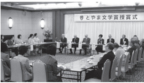
木崎さと子先生を囲んでの懇談会

2階「嘉月」にて行いました。今回の文学賞には、総数76編(小説11、評論0、児童文学3、随筆2、詩30、短歌8、俳句18、川柳4)の応募があり、芥川賞作家の木崎さと子先生と、東大名誉教授(比較詩学・比較文化論専攻)の川本皓嗣先生による選考の結果、上記の通り決定しました。選者の木崎さと子先生をお迎えして行われた式で