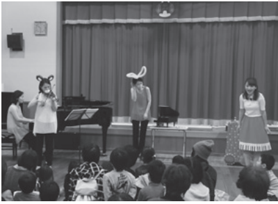
1月28日 社会福祉法人和田保育園

法人和田保育園で洋楽のエンジェリズムがピアノ、ヴァイオリン、語りによる「エンジェリズムの童謡メドレー」など5曲を演奏。演奏の途中には、楽器紹介としてヴァイオリンクイズやバルーンアートがあり、子どもたちが見ていて楽しい公演になりました。エンジェリズムからは、風船で作った雪だるまが保育園にプレゼントされました。