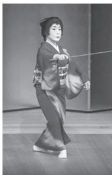
御祝儀 長唄「新曲浦島」