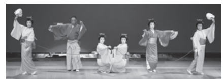
地唄箏曲「残月」—国宝 瑞龍寺によせて—