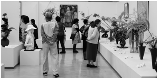
いけばなと美術作品の展示