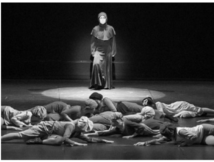
「カルミナ・ブラーナ」

「DEEP IMPRESSIONS」は下記のチェコ・プラハ公演で、「カルミナ・ブラーナ」は第16回モナコ世界演劇祭でも上演されました。