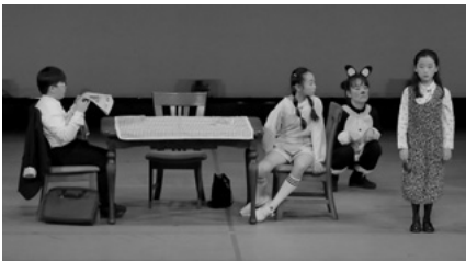
リトルDOMO (韓国江原道)