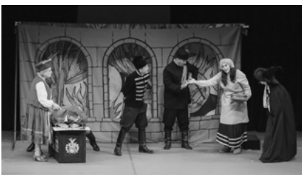
劇団プレイヤーズ・スタジオ・デブレツェン (ハンガリー)

ロシアの沿海地方、アメリカのオレゴン州、ブラジルのサンパウロ州、リトニア、オーストラリア、ポーランドの計9か国173点の児童画が展示されました。また、ハンガリーのハイドゥー・ハビハール県・ハイドゥーナナーシュ、韓国、オーストラリア、ベルギー、アメリカの子どもたちからは創作童話21作品が特別に寄せられました。