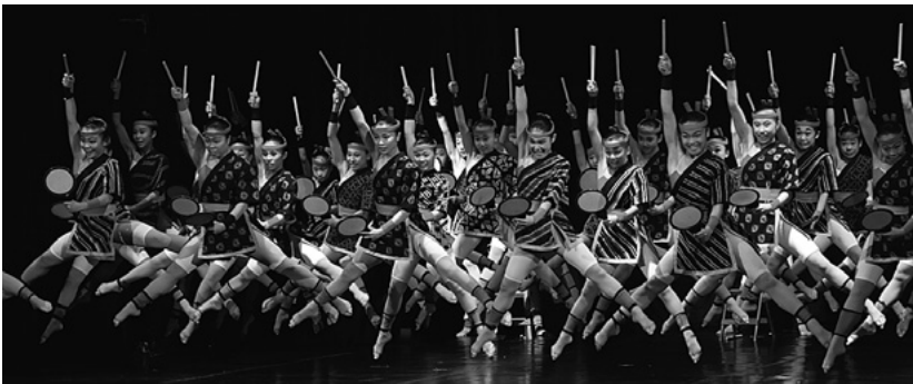
ブロードウェイ劇場での公演

8月18日(金)のチェコ・プラハのブロードウェイ劇場での公演は、可西舞踊研究所と長く親交を深めてきた