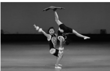
瀋陽民族芸術学校 (中国遼寧省)