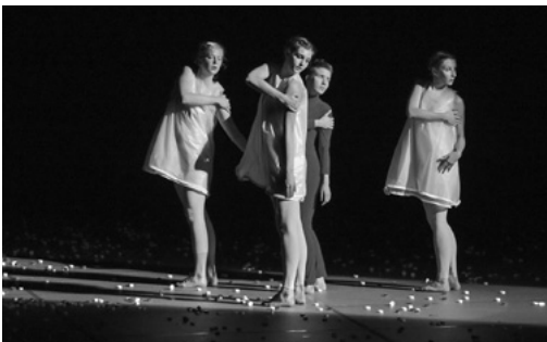
国際交流公演(チェコ・プラハ芸術大学舞踊学科)

開会式典では、県部門功労(文化学分野)の表彰式が行われ、受賞者に表彰状と記念品が贈られました。(9ページ、およろこびの人々参照)。