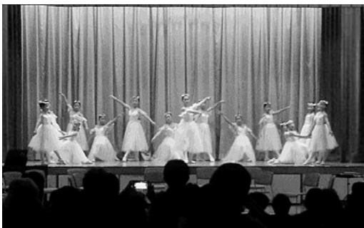
11月5日 黒部市立愛本公民館

11月5日(日)は黒部市立愛本公民館で洋舞と洋楽の公演が行われました。洋舞公演にはニシムラヤスコダンスフアクトリー、大川都バレエ教室が出演。可愛らしい衣装を身にまとい、感性豊かな踊りを披露。次の洋楽公演では、とやまレディースオーケストラOASISが「花のワルツ」から「ふるさとの空」まで幅広いレパートリーを披露。オーケストラならではの迫力ある演奏に観客たちは真剣に聴き入っていました。観客から質問タイムもあり、洋舞と洋楽について理解を深めました。