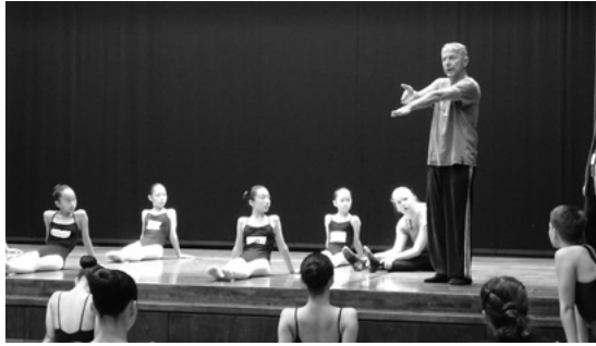
(洋舞部門) ヴァーツラフ・ヤナチエク先生