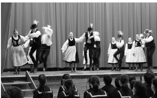
11月14日 富山市立杉原中学校

11月14日(火)、さみどり認定こども園での公演には、邦楽の沢井箏曲院さつき会、韓国・リトルDOMO、ハンガリー・プレイヤーズ・スタジオ・デブレツェンが出演しました。邦楽は箏で「大きな古時計」「さんぽ」などを演奏し、園児が曲に合わせて歌うシーンもありました。リトルDOMOの演劇では、韓国語上演ながら園児たちは舞台に引き込まれるように見入り、プレイヤーズ・スタジオは歌や音楽も交え、観客参加型の皆で一緒に楽しむスタイルの演技を披露しました。