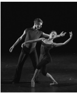
「IN THE RAIN AGAIN」

2日目には、プラハ・ボヘミアバレエ団による小作品集と合わせて、カール・オルフ作曲、イヴァンカ・クビツォヴァー演出・振付の「カル