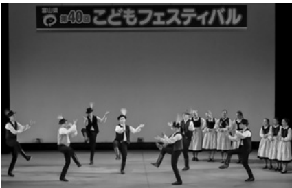
ゴールデン・ストロー・フォーク・ダンス・グループ (ハンガリー)