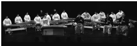
第2部 「日本民謡による組曲」