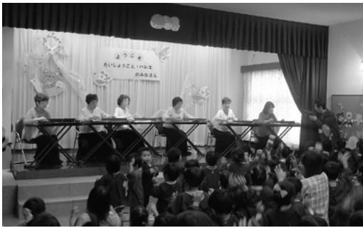
10月17日 東般若保育園

10月17日(火)は、東般若保育園 に於いて大正琴の琴伝流 ミュージックBOX ピュア燦ス、洋舞の県洋舞協会が出演。大正琴公演では、「おどるポンポコリン」や「サザエさん」など園児たちは大きな声で一緒に歌いながら演奏を聴いていました。洋舞公演では「そして、森の中へ…」など洗練された身のこなしに園児たちは真剣に見入っていました。最後の「みんなで踊ろう！ちびっこカウボーイ」では、園児たちは楽しそうに出演者と一緒に踊っていました。