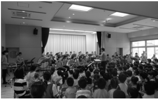
8月24日 水戸田保育園

平成29年度県民ふれあい公演の最初の公演が、 8月24日(木)に水戸田保育園 に於いて行われました。射水市立射北中学校吹奏楽部がお揃いのTシャツを着て「ジブリ・ソングス」や「ミッキーマウス・マーチ」など園児が好きな曲を演奏。園児たちは一緒に歌ったり、手拍子をしたりして大いに楽しみました。また、短い曲を演奏しながら楽器紹介も行い、楽器を演奏する楽しみを伝えました。