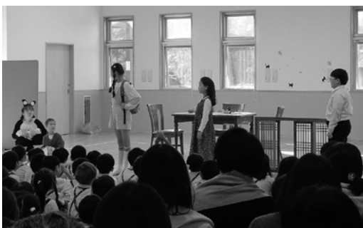
11月13日 かたかご幼稚園かたかご保育園

11月13日(月)に富山聖マリア保育園で行われた公演には、洋楽のTORIO Paul、中国遼寧省・瀋陽民族芸術学校、ハンガリー・ゴールドデン・ストロー・フォーク・ダンス・グループが出演。フルート、ピアノ、ファゴットで「どんぐりころころ」他3曲を演奏したほか、中国の青少年による雑技、舞踊、笛などの高度な演技、ハンガリーのスピーディで力強い民俗舞踊と、バラエティと国際色豊かなステージとなりました。園児たちは間近で見る演技の迫力に歓声をあげていました。