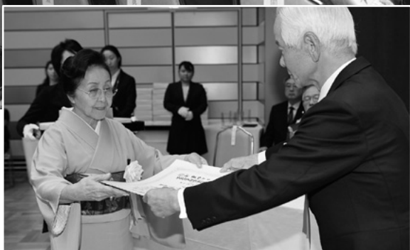
平成29年度 芸文協表彰式