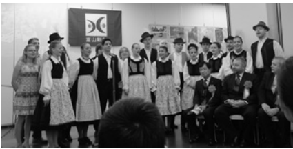
開会式でゴールデン・ストロー・フォーク・ダンス・グループ (ハンガリー) の歌声が披露された

海外からの特別展示として、ハンガリーのハイドゥー・ハビハール県・ハイドゥーナナーシュ、中国の遼寧省・上海、韓国の江原道、