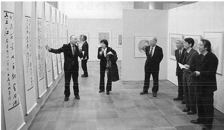
中国遼寧省文学芸術界連合会の文化代表団による作品解説

また、展覧会の開会に合わせ、芸文協と友好提携を結ぶ中国遼寧省文学芸術界連合会の文化代表団6名が