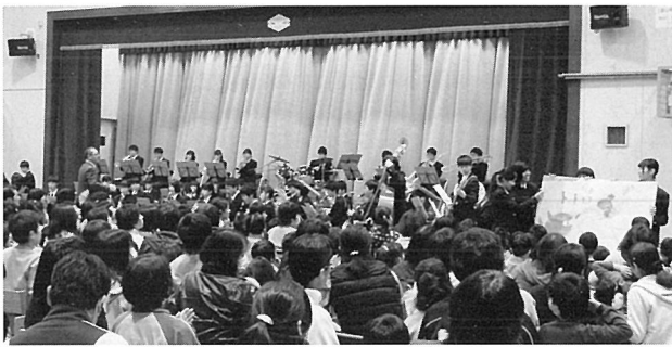
12月15日 県立しらとり支援学校

富山工業高校吹奏楽部がレベルの高い演奏を披露しました。「レットイットゴー」では「アナと雪の女王」の登場人物に扮した吹奏楽部員が出てきたり、「となりのトトロ」では演奏中にトトロの絵を描いたり、楽しい公演でした。支援学校の生徒たちが踊りだすなど、とても盛り上がりました。