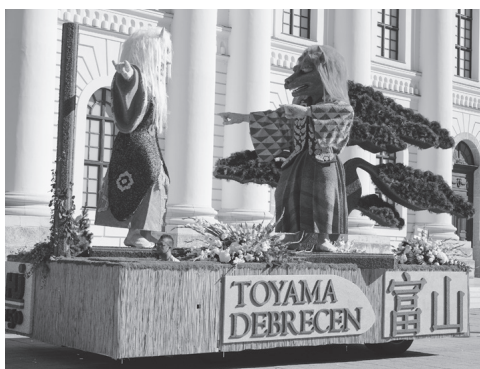
「連獅子」をかたどった花車