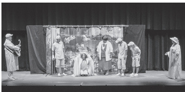
ハンガリー・劇団プレイヤーズ・スタジオ・デブレツェン「みにくいあひる」

す。海外団体と県内団体がそれぞれ舞台を披露し、4年に1度のフェスティバルに向けてPRを行います。