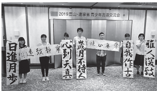
富山での書道交流会

察を行いました。 9月14日(土)～16日(月)祝)には高岡文化ホールで「富山・遼寧省青少年書画展2019」を開催し、遼寧省の子どもの書画作品35点を展示しました。それに合わせ同省から代表団が来県し、作品を鑑賞しました。また、7月に訪中した富山の子どもの書画による書道交流会を開催。書を通して交流を深めました。