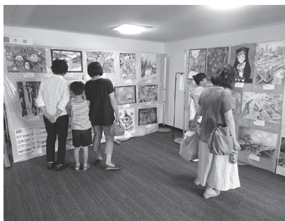
とやま国際子ども美術展2019