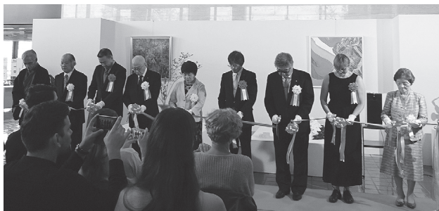
生活文化展開会式

開会式典では、県部門功労(文化分野)の表彰式が行われ、受賞者に表彰状と記念品が贈られました。(下記「およろこびの人々」参照)。 三日間に亘り開催された生活文化展では、県内13流派と一般公募によるいけばな作品220点と、日本画・洋画・彫刻・工芸・書・写真の作品60点が展示され、華道と美術が融合した独特の芸術空間に観覧者は見入っていました。