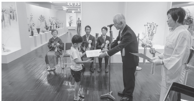
奨励賞と記念品の贈呈